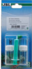
JBL Teileset für Wassertests