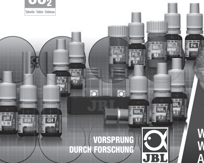
Tabella - Table - Tableau