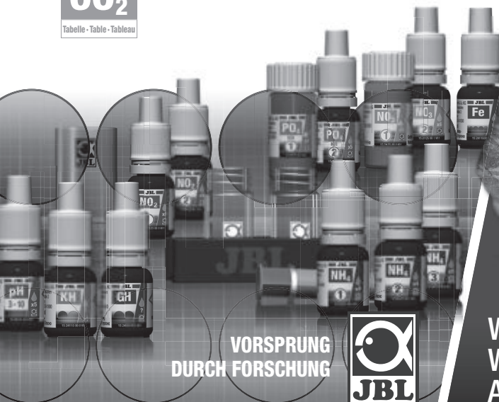
Tabella - Table - Tableau