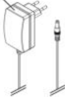
JBL ProTemp Cooler x200/x300 Netzteil