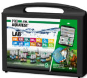
JBL PROAQUATEST LAB Testkoffer mit 13 Wassertests zur Süßwasser-Analyse