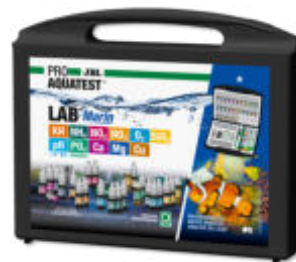
JBL PROAQUATEST LAB Marin Professioneller Testkoffer zur Meerwasser-Analyse