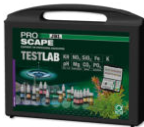
JBL PROAQUATEST LAB PROSCAPE Testkoffer zur Wasseranalyse in Pflanzenaquarien