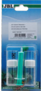
JBL Teileset für Wassertests