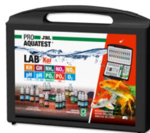
JBL PROAQUATEST LAB Koi Professioneller Testkoffer für Koi- und Gartenteich