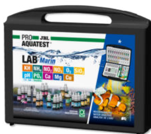
JBL PROAQUATEST LAB Marin Professioneller Testkoffer zur Meerwasser-Analyse